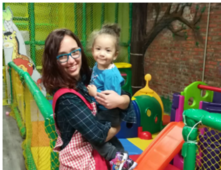
Kyria Parrull Baby Xic