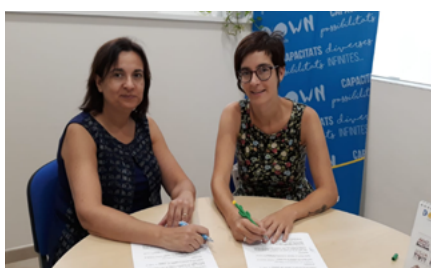
La Tribu Fera