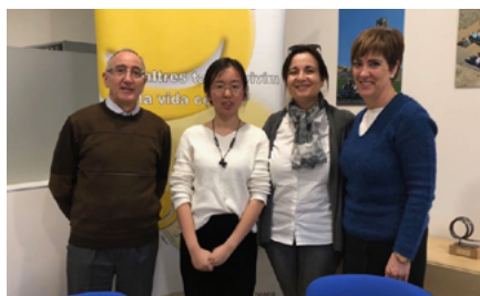
Diploma d'Estudis Hispànics UDL