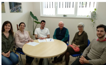
ASN (Alternative Swine Nutrition)