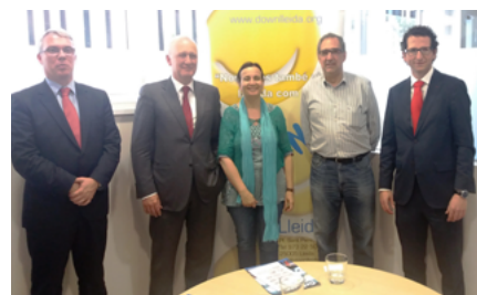
Fundación Banco Santander