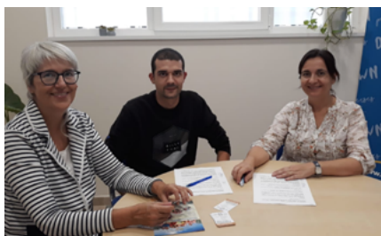
Beach Sport & Soccer