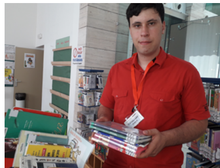
Miquel Delaurens Biblioteca Pública